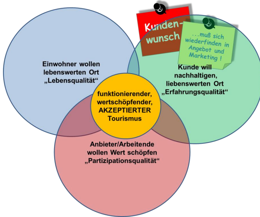
Übersicht 4: Zukunftsbild des Tourismus St. Peter-Ordings 2025/2030